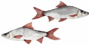
Skalle Lever mellem beplantning. En del af karpfamilien. Har ingen tænder.